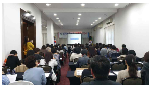
독립운동사 일반과 남미 한인 이주사 강의