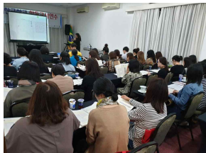
교육콘텐츠구성 및 활용방법 설명